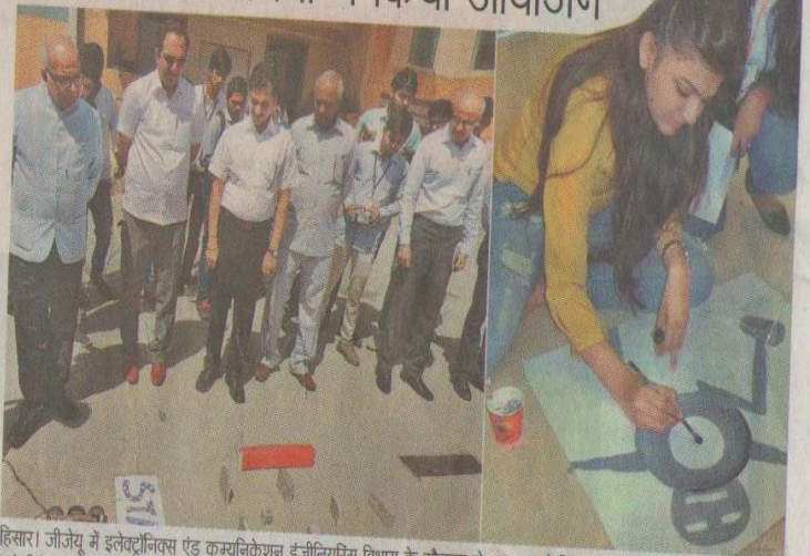
हिसार। जीजेयू में इलेक्ट्रॉनिकस एंड कम्युनिकेशन इंजीनियरिंग विभाग के सौजन्य से शुरू हुए दो दिवसीय राज्यस्तरीय टेक्नोकल फैस्ट 'ओरबिटेक 2के16' में भाग लेने वाले छात्रों (बाएं) पोस्टर मैकिंग प्रतियोगिता में भाग लेते प्रतिभागी।

'ओरबिटेक-2 के 16' प्रतियोगिता का आयोजन जीजेयू के इलेक्ट्रॉनिकस विभाग