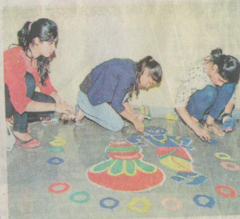
जीजेयू में आयोजित कार्यक्रम के दौरान रंगोली सजाती छात्राएं।