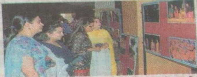
जीजेयू के जनसंचार विभाग में चित्र प्रदर्शनी देखती टीचर व विद्यार्थी