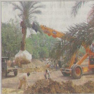
हिसार में गुरु जंभेश्वर विज्ञान व प्रौद्योगिकी विश्वविद्यालय में खजूर के पेड़ को ले जाते कर्मचारी। -रुप

ऐसे हुई शुरूआत गुरु जंभेश्वर विश्वविद्यालय की स्थापना वर्ष-1996 में 2 कमरों से हुई थी। इसके बाद यहाँ भवन तो बन गए लेकिन उनकी शोभा बढ़ाने वाले पेड़ बड़े नहीं हो पाए। ऐसे हालात में वर्ष-2009 में नेशनल एक्सीडेंटेशन कार्डरिल की टीम का विवि में दौरा आयोजित किया गया।