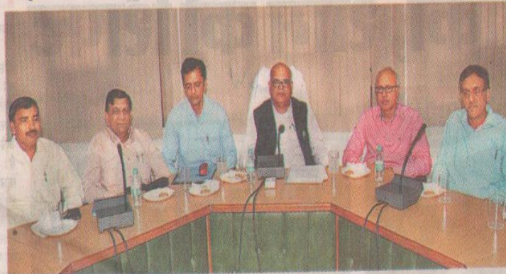
हिसार। जीजेयू में पत्रकार वार्ता में जानकारी देते कुलपति व अन्य।

कुलपति ने कहा कि नेशनल इंस्टीट्यूशन रैंकिंग प्रोग्राम मिनिस्ट्री ऑफ रिसोर्स डेवलपमेंट की ओर से देश भर के 3500 शिक्षण संस्थानों में सर्वे किया गया था। हरियाणा, उत्तराखंड, पंजाब, हिमाचल प्रदेश व जम्मू एंड कश्मीर राज्यों में जीजेयू पहले स्थान पर रहा है। रैंकिंग मानव संसाधन मंत्री स्मृति इरानी ने घोषित की। लगातार तीन बार ए ग्रेड प्राप्त विश्वविद्यालय के शिक्षकों, कर्मचारियों, शोधार्थियों व विद्यार्थियों के लिए यह गर्व की बात है। विश्वविद्यालय में उत्सव का माहौल है। साथ ही इस रैंकिंग से विवि परिवार की जिम्मेदारियां व अपेक्षाएं बढ़ गई