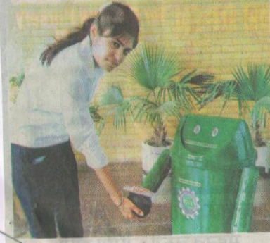
जीजेयू में विद्यार्थियों द्वारा बनाए गए रोबोट से हाथ मिलानती छात्रा। खबर पेज-6 पर