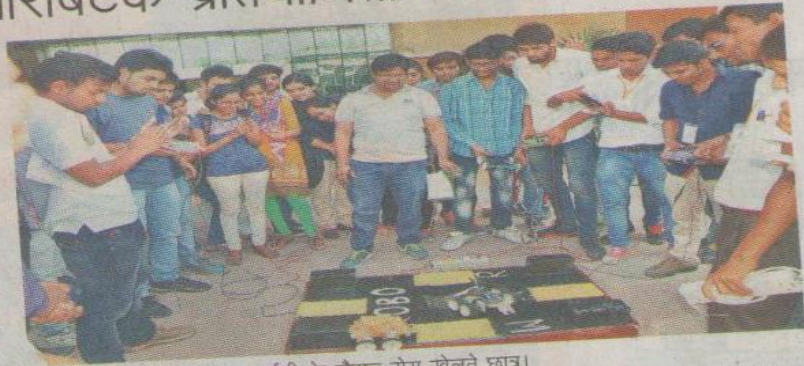
हिसार। जीजेयू में रोबोट प्रदर्शनी के दौरान गेम खेलते छात्र।